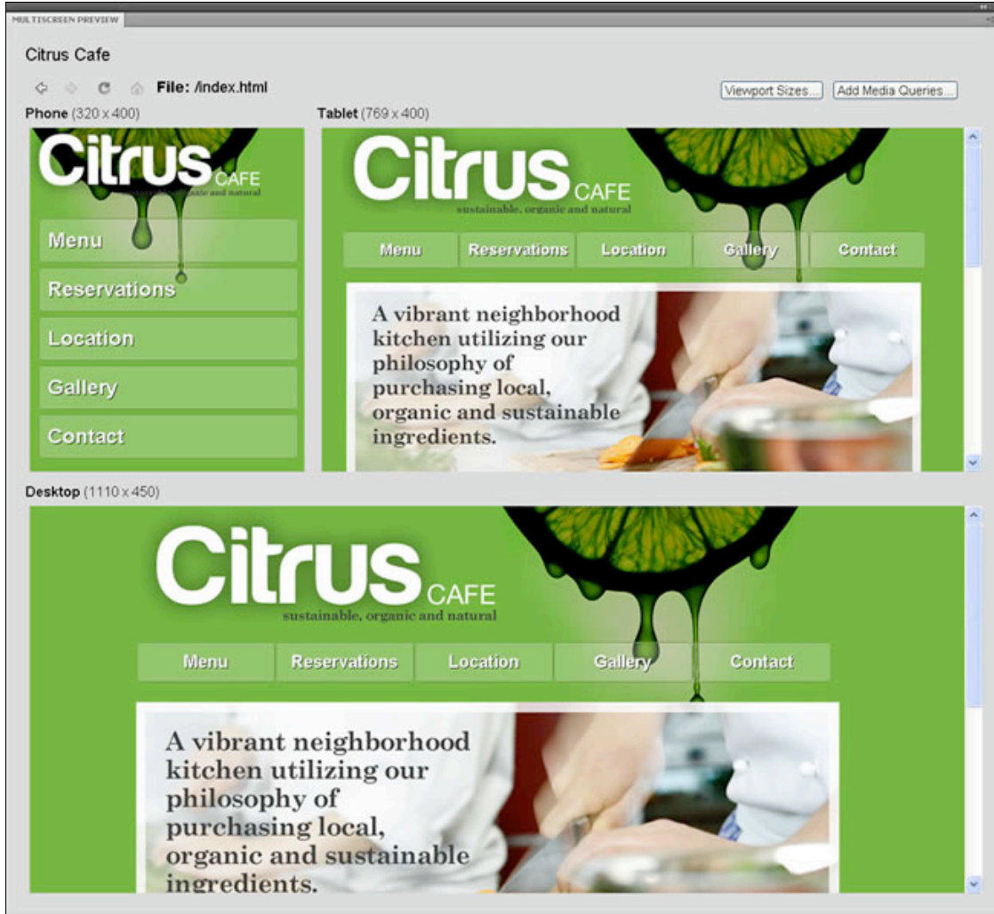
図 2. マルチスクリーンプレビューパネル

スマートフォン、タブレット、そしてデスクトップのプレビューに使用される領域の広さは標準値が設定されています。しかし、マルチスクリーンプレビューパネルの Viewport Sizes ボタンをクリックすることでこれらの数値を簡単に調整することができます。